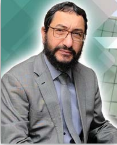
بإقلام السيد المدير العام : حيدر ناصر