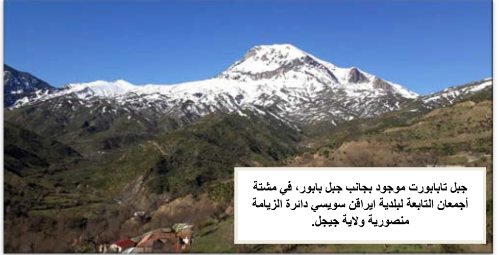
جبل تابابورت موجود بجانب جبل بابور، في مشقة أجمعان التابعة لبلدية ايراقن سويسري دائرة الزيامة منصورية ولاية جيجل.

الجميلة للجبال في القرآن الكريم أيضا ذكر ألوانها في قوله تعالى في سورة فاطر: ﴿ أَلَمْ تَرَ أَنَّ اللَّهَ أَنْزَلَ مِنَ السَّمَاءِ مَاءً فَأَخْرَجْنَا بِهِ ثَمَرَاتٍ مُخْتَلِفًا أَلْوَانُهَا وَمِنَ الْجِبَالِ جُدَدٌ بِيضٌ وَحُمْرٌ مُخْتَلِفٌ أَلْوَانُهَا وَعَرَايِبٌ سُوْدٌ ﴾. ونذكر أيضا ما أضفاه رسول الله صلى الله عليه وسلم على جبل أحد من مشاعر وجدانية في قوله فيما رواه البخاري: " أَحَدُ جَبَلٍ يُحِبُّنَا وَنُحِبُّهُ" ومخاطبته له لما اهتز من تحته فيما رواه الترمذي: " اثبت أَحَدُ فَأَتَمَّا عَلَيْكَ نَبِيٌّ وَصِدِّيقٌ