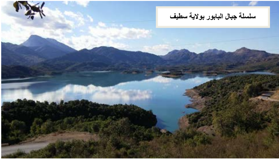
سلسلة جبال البابور بولاية سطيف